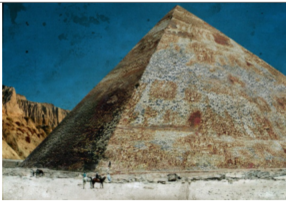
Пирамиды Египта, исходное состояние