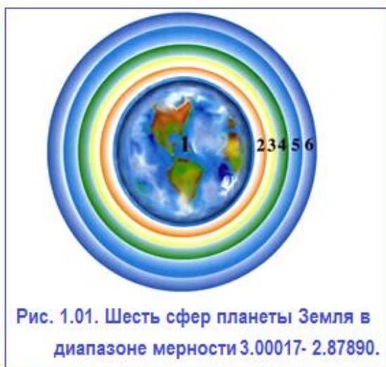
Рис. 1.01. Шесть сфер планеты Земля в диапазоне мерности 3.00017- 2.87890.