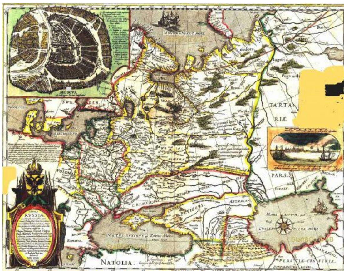
Фрагмент карты Гессель-Геретиса 1613-1614

Два года назад по местному телевидению было сообщение о том, что школьники вместе со своим учителем нашли древнюю абсерваторию, похожую на Стоухендж. Однако комментаторы отнесли это сооружение к греческим постройкам, а надписи - к греческим надписям. Больше эта информация не демонстрировалась по телевидению и сообщений в других средствах массовой информации не было. Это способ замалчивания нашей истории.