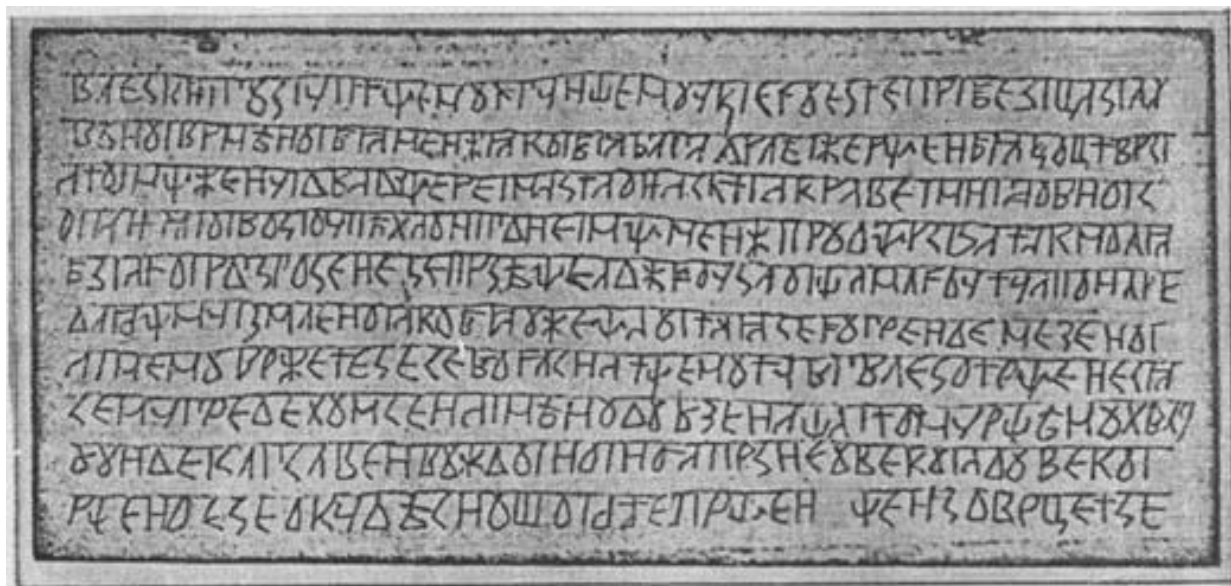
Дощечка из Велесовой книги

Следует напомнить, что только после катастрофы, произошедшей 11 008 г. до н. э., около 6-7 тысяч лет назад, освободившаяся от льда Венея (Европа) и север Азии стали заселяться вновь. Со временем образовалась великая Империя, которую называли по-разному: Тартарией, Моголией или Расеей, которая до 6-7 века н.э. включала всю Европу и Азию - от Атлантического океана до Тихого и Север Северной Америки. В нее входила провинция Русколань, в разное время имевшая разные названия и разные границы. Например, в «Книге Велеса» 5 сказано, что ее Древняя столица Кияр находилась вблизи горы «Великой Алатыря» (Эльбруса). В слове "Русколань" есть слог " лан ", присутствующий в словах " длань ", "долина" и означающий: простор, территория, место, регион. В последствии слог " лан " преобразился в land . Сергей Лесной в своей книге "Откуда ты, Русь?" говорит следующее: "В отношении слова "Русколунь" следует заметить, что есть и вариант "Русколань". Если последний вариант более правильный, то можно понять слово иначе: "руск(ая) лань". Лан - поле. Все выражение: "Русское поле". Кроме этого, Лесной делает предположение, что существовало слово "колунь", означавшее, вероятно, какое-то пространство. Встречается оно и в ином словесном окружении.