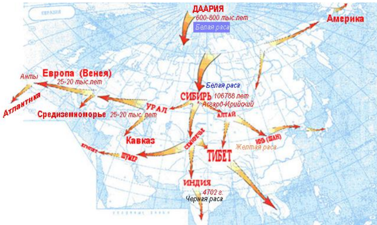
Предполагаемая схема переселения народов.

После похолодания 25000-2000 лет назад отсюда началось расселение Белой Расы по всем сторонам света (см. схему расселения народов Беловодья), в том числе и на Кавказ, образовав со временем Асию - Славяно-Арийскую империю от Моря Западного (Атлантического океана) до Тихого океана и далее весь Север Северной Америки.