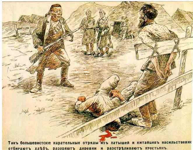
Так большевистские карательные отряды из латышей и китайцев насильственно отбирают хлеб, разоряют деревни и разстреливают крестьян.

То война, одна, другая, То вдруг голод или мор. Стала Русь почти нагая.