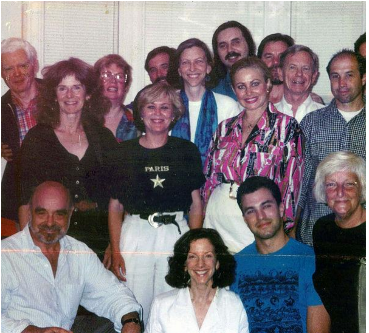
Участники Второго Семинара, Сан-Франциско 1993 год