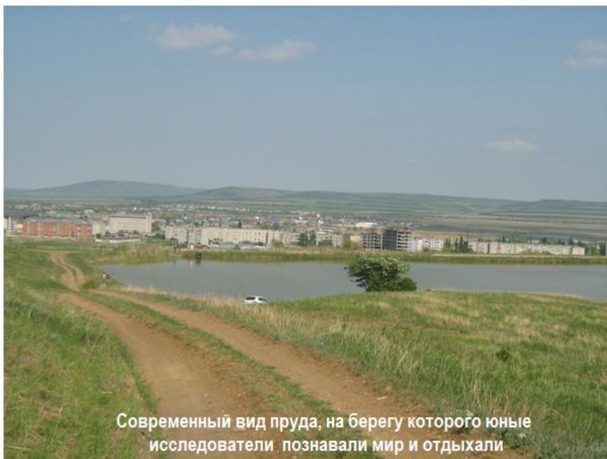
Современный вид пруда, на берегу которого юные исследователи познавали мир и отдыхали