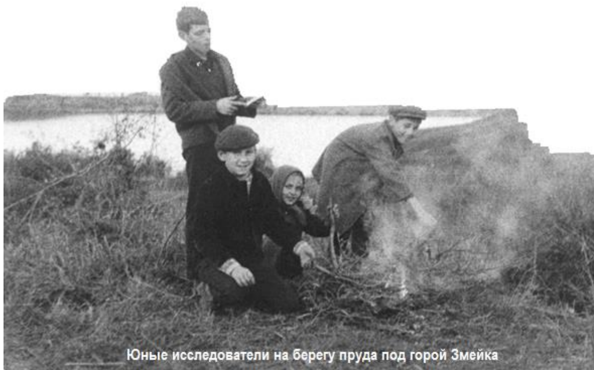
Юные исследователи на берегу пруда под горой Змейка