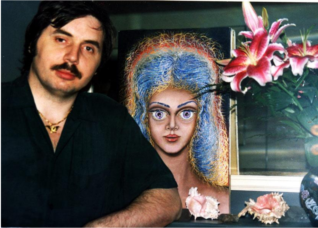
На фоне портрета Иоллои (Ойи), 1996 год

Гордость ощущаешь за наш народ, за нашу русскую науку, что именно на Руси родился великий Рус, принёсший ей славу. И пусть ещё не осознаваемую и не признаваемую официальной наукой, которая могла лишь вынести вердикт, что «эти знания преждевременны» . Тем самым она подписала себе приговор, подтвердив, что сама она давно превратилась в новую религию с новой инквизицией. Но придёт время, когда его концепция мироустройства войдёт и в школьные учебники, люди будут иметь неискажённой представлении о мире, в котором они живут.