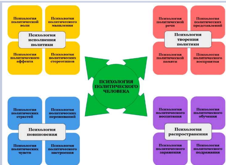
Психология политического человека