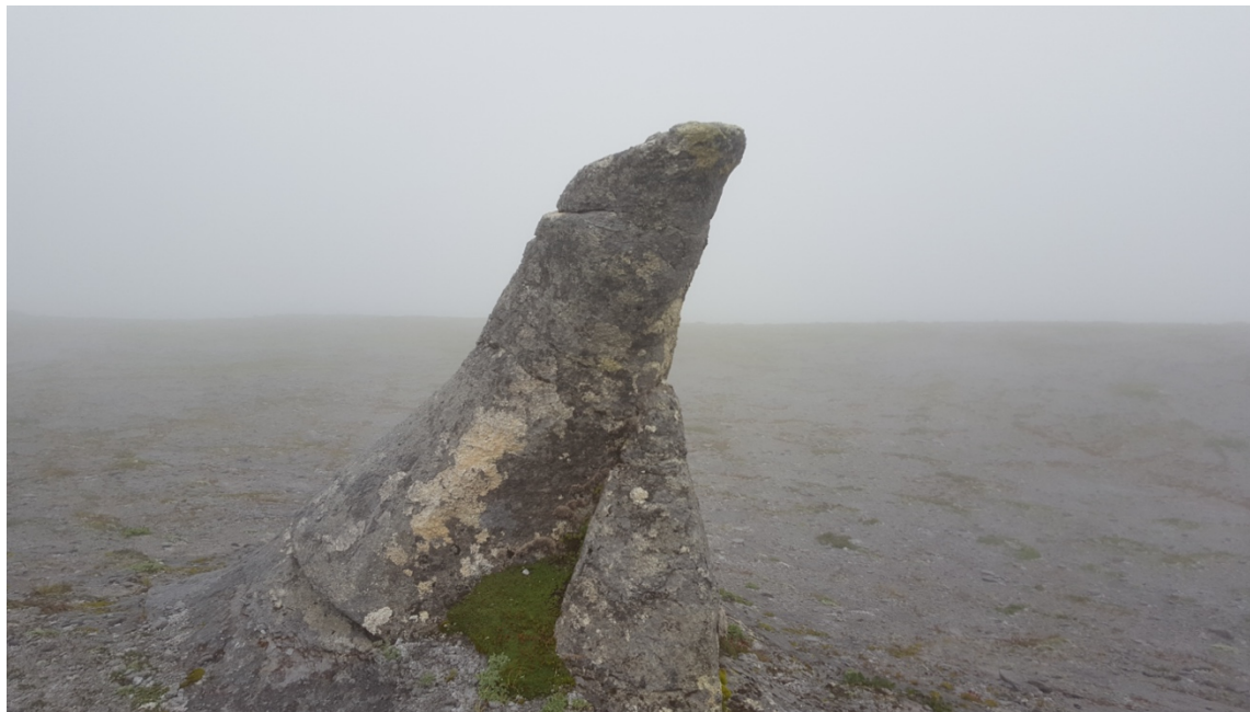
Местные краеведы дали ему название «Сокол»

А вот и ещё один удивительный каменный монумент, как говорится, один посреди всего поля (склона).