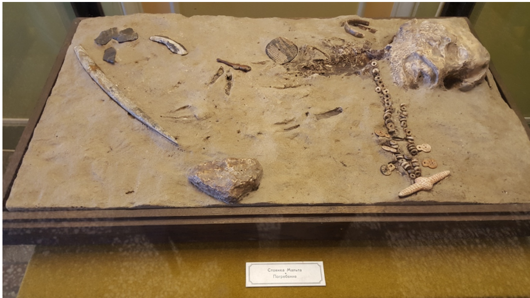
Рис. 1 Мой снимок экспоната, сделанный в Эрмитаже

В основе этих исследований хранящийся в Эрмитаже скелет ребёнка, который археологи нашли в конце 1920-х годов у села Мальта на территории современной Иркутской области (западнее оз. Байкал). В том месте располагалась одна из самых известных позднепалеолитических стоянок Сибири. Учёные извлекли генный материал из кости руки 4-летнего мальчика, погребённого рядом со статуэткой полиатической Вены, однотипные с теми, которые были также найдены в Костёнках Воронежская обл. (представлены также в Эрмитаже) и на о. Мальта.