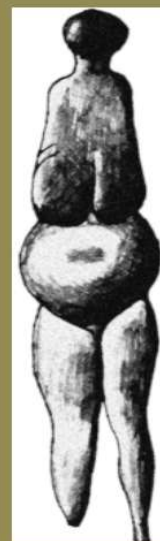
Женские фигурки Стоянки Мальта, Буреть Иркутская область, кость Возраст : 20-25 тыс.лет