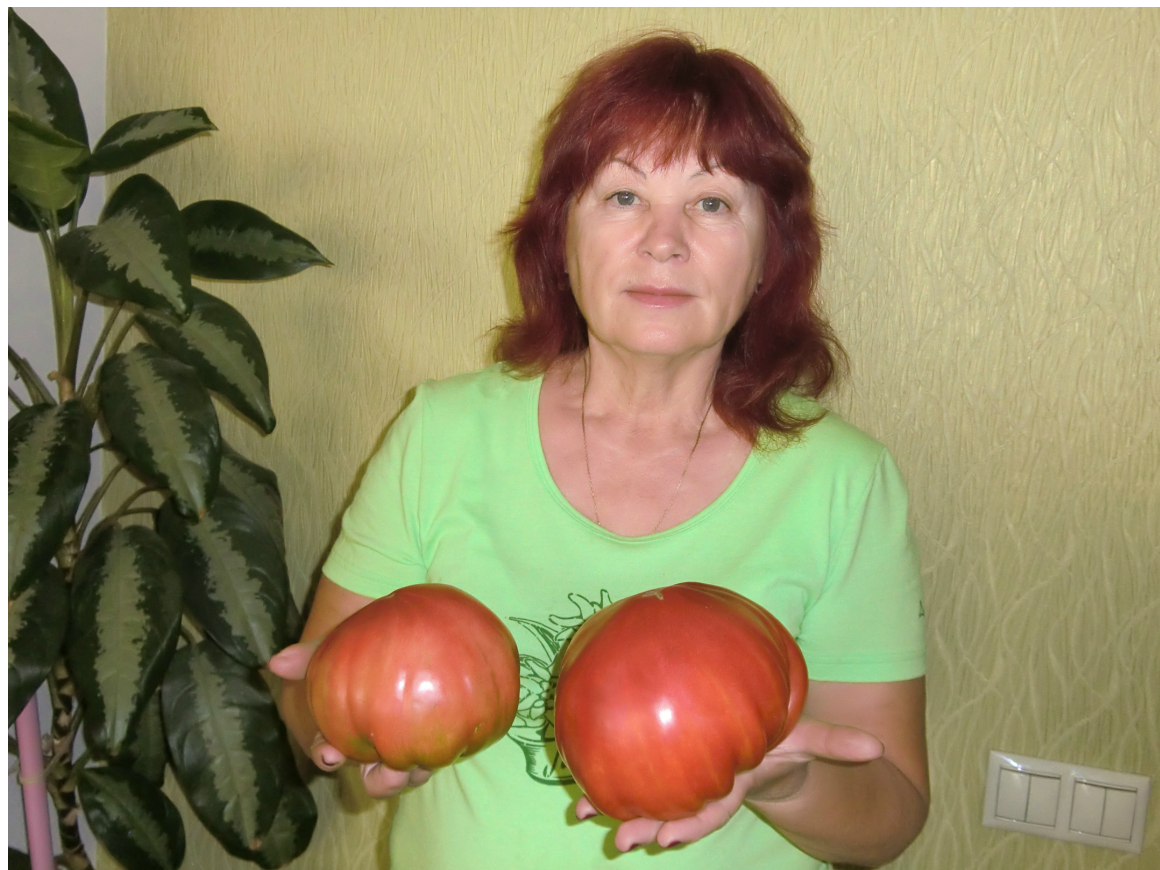
Самый большой помидор весил 1 700 грамм. Они же в теплице ещё во время роста

Помидоры находились под особым наблюдением, так как на протяжении более десяти лет урожаи этого овоща, прямо скажем, не удовлетворяли, не смотря на все старания с семенным фондом, агротехникой и т.д. Вот рекордсмены от семян, которые мы приобрели в Италии в обыкновенном киоске, торгующем цветами: