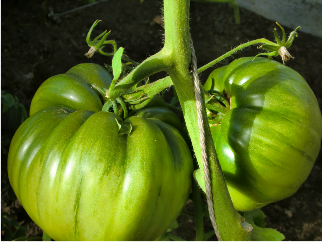
Другой куст того же сорта: